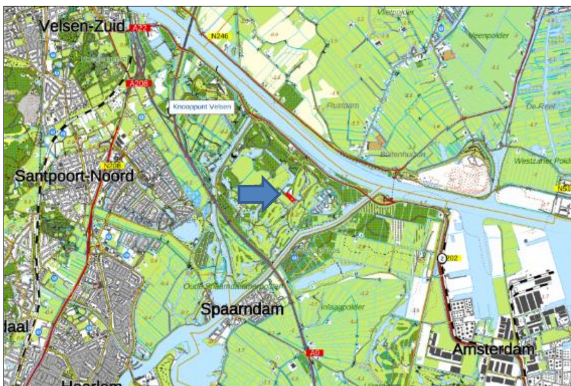
Figuur 1. Topografische kaart ligging van het plangebied

Het plangebied is gelegen in Velsen-Zuid, in het Recreatiegebied Spaarnwoude. Het ligt ten zuiden van het Noordzeekanaal, 5 kilometer ten noordoosten van Haarlem. Het plangebied is gelegen temidden van golfbanen. In figuur 1 is de topografische ligging van het plangebied weergegeven.