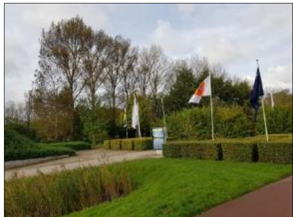
Figuur 4. Noordelijk deel plangebied