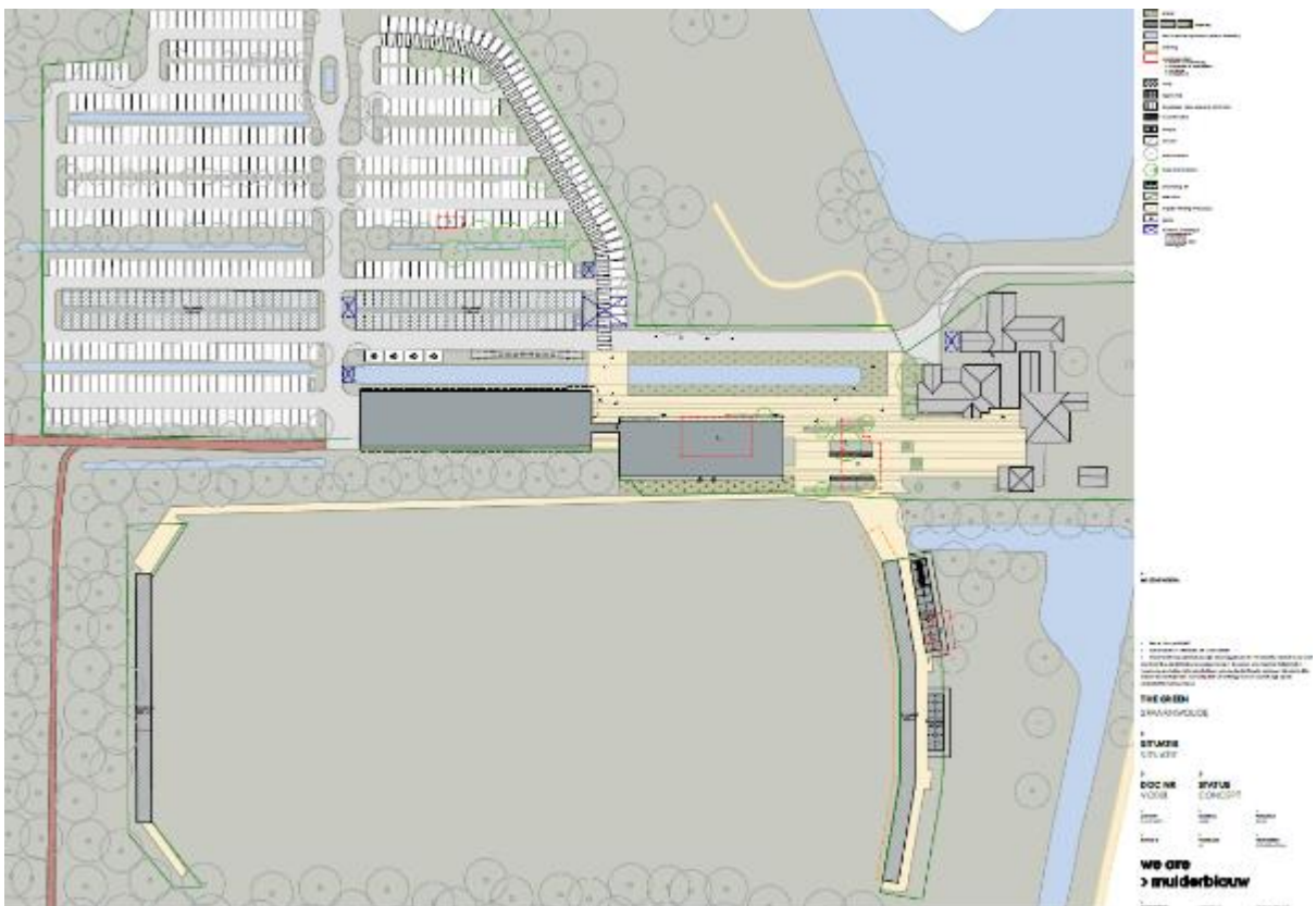
Figuur 15. Toekomstige situatie plangebied

Het voornemen is om in het plangebied een hotel te realiseren (zie figuur 15). Op de locatie staan echter vier opstallen die hiervoor gesloopt zullen moeten worden. Het hotel in het westen wordt gerealiseerd tegen het bos aan, wel wordt hier een sloot op de parkeerplaats gedempt. In het zuidoosten van het plangebied wordt een entreeplein gerealiseerd. Dit deel is al verhard. Ook wordt ten oosten van de driving range een fietsen- en buggystalling aangelegd, en wordt het voetgangerspad verbreed voor de bewegingen van buggy's.