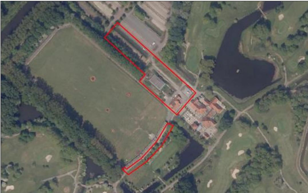
Figuur 2. Luchtfoto van het plangebied en de directe omgeving