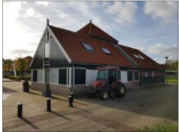
Figuur 8. Gebouw met dakpannen dak