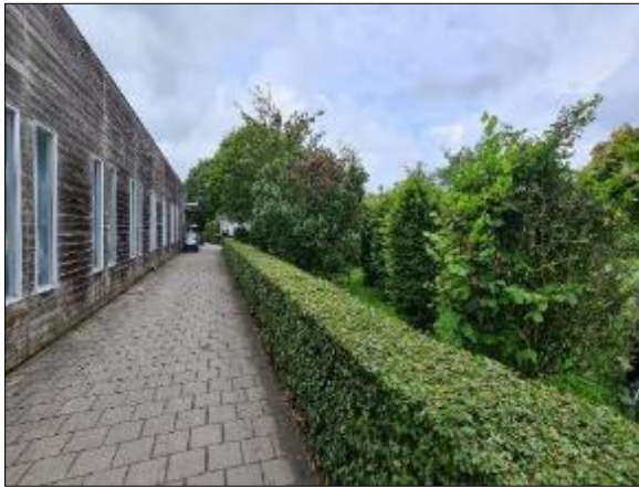
Figuur 13. Zuidoostelijke deel plangebied achter driving range