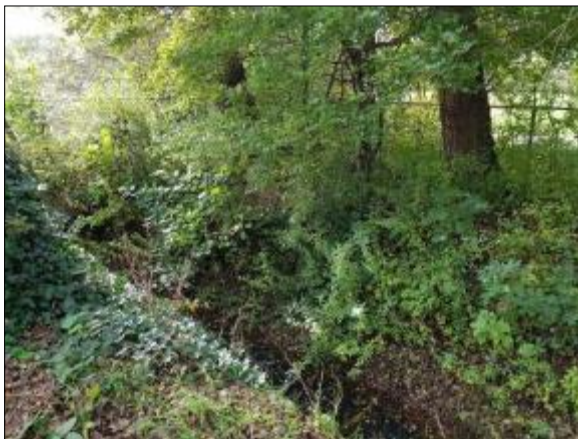
Figuur 11. Begroeiing en afwateringsgreppel in noorden van het plangebied