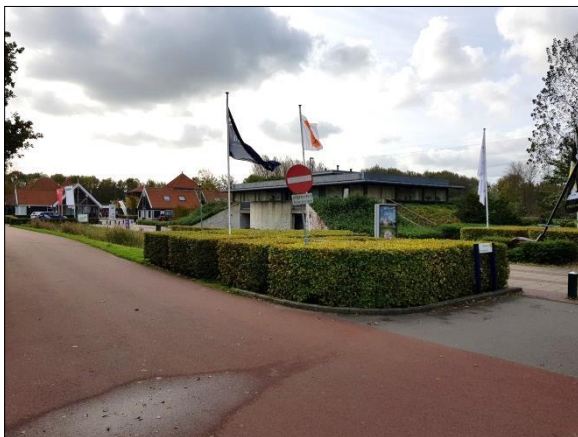
Figuur 3. Zuidelijk deel plangebied