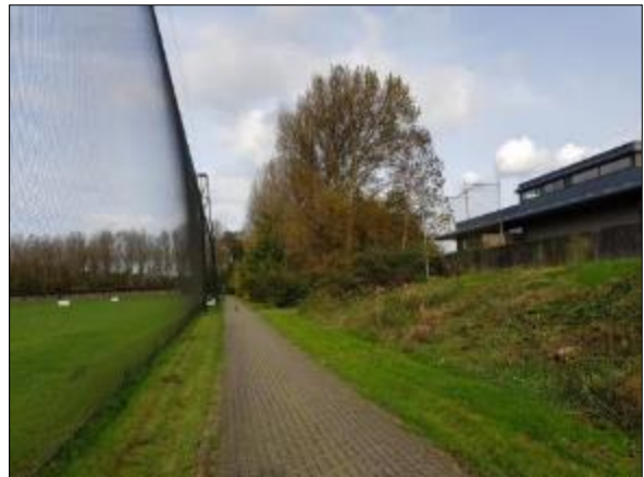
Figuur 10. Zuidwest grens van het plangebied