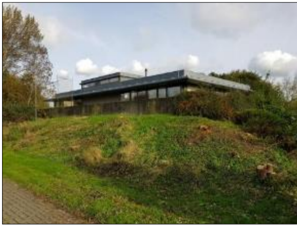
Figuur 9. Achterzijde gebouw met platdak