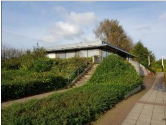
Figuur 7. Betonnen gebouw met plat dak