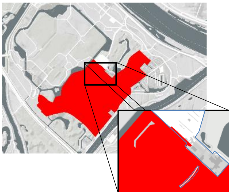
Figuur 17: Uitsnede 'Wijziging werkingsgebieden OV NH2020 & OV NH2022 ronde 2023-I (ontwerp)' met in rood het te verwijderen NNN-gebied en blauw omkaderd het plangebied