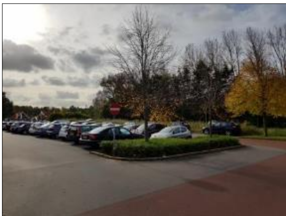
Figuur 5. Parkeerplaats en te dempen sloot vanaf noorden van het plangebied