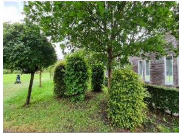
Figuur 14. Gedeelte NNN achter driving range