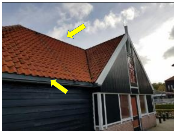
Figuur 18. Toegang voor huismussen, spreeuw etc.

De te slopen bebouwing met dakpannen daken biedt potentiële nestgelegenheid aan soorten als de huismus, spreeuw en zwarte roodstaart (zie figuur 18). Tijdens het veldbezoek is ook nestmateriaal onder de dakpannen aangetroffen. Het is echter niet op basis van de quickscan te bepalen of het hier nesten van huismus (jaarrond beschermd) en/of spreeuwen (niet jaarrond beschermd) betreft. Beide soorten zijn ter plaatse van het golfterrein waargenomen ten tijde van het veldbezoek. Het betreffende dak biedt ook nestmogelijkheden voor de gierzwaluw (zie figuur 19). Gezien de gierzwaluw (nest eveneens jaarrond beschermd) veel meer gebonden is aan het stedelijke gebied, is het niet te verwachten dat deze binnen de bebouwing op het golfterrein broedt. Volledige uitsluitel hieromtrent kan echter alleen worden verkregen middels gericht veldonderzoek gedurende het broedseizoen. Het gebouw met platdak is verder hermetisch afgesloten en beschikt daardoor niet over nestmogelijkheden voor vogels. In de aangrenzende bomen bevinden zich geen (potentiele) jaarrond beschermde nesten van vogels als buizerd, sperwer en ransuil. Evenmin zijn er spechtenholtes aangetroffen. In het te verwijderen groen (bijvoorbeeld struweel) kunnen wel soorten als merel, winterkoning, roodborst, heggenmus en houtduif tot broeden komen.