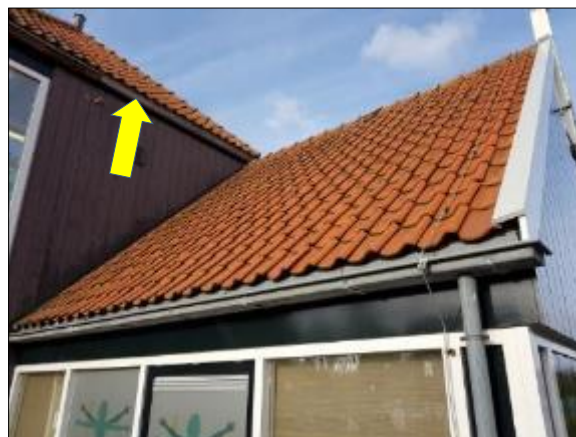
Figuur 19. Toegang voor gierzwaluw en vleermuizen