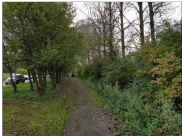
Figuur 12. Bomenrij waar noordelijk deel van het plangebied deel van uitmaakt