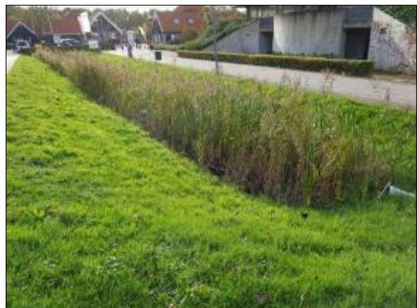
Figuur 6. Sloot in het noordoosten van het plangebied