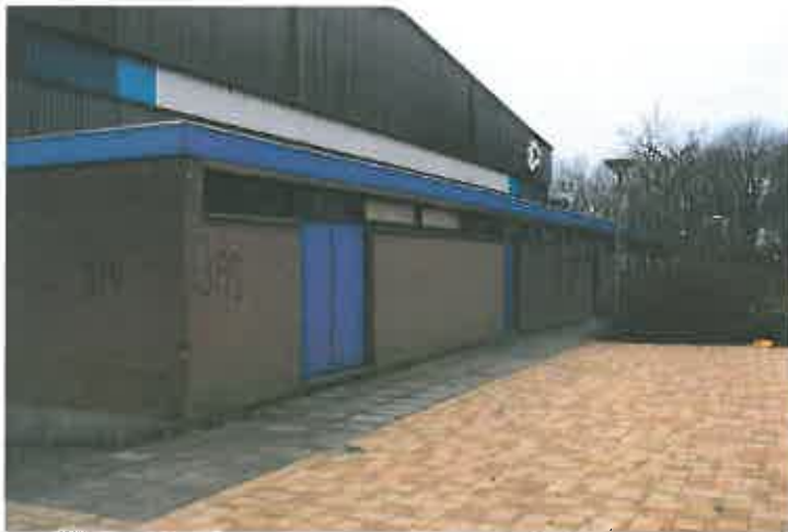
Figuur 5. Sporthal ongeschikt als verblijfplaats voor vleermuizen

Potentieel geschikte vaste rust- en verblijfplaatsen voor vleermuizen zijn niet aanwezig binnen het plangebied, vanwege het ontbreken van geschikte boomholtes en potentieel geschikte bebouwing. Aangezien de sporthal grotendeel geen toegankelijke spouwmuur bevat en bekleed is met enkelwandige stalen golfplaten wordt niet verwacht dat vleermuizen het gebouw gebruiken als vaste rust- en verblijfplaats. Ook het type dakbedekking maakt het niet mogelijk dat vleermuizen onder het dakbeschot een verblijfplaats hebben.