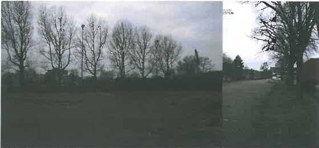
Figuur 3. Foto's plangebied

De Sporthal bestaat uit een vrij hoog gebouw voorzien van deels een plat dak en deels een licht hellend dak voorzien van bitumen of een golfplaten dakbekleding. De gevel van de sporthal is grotendeels voorzien van golfplaten, alleen het onderste deel van het gebouw (ca. 2 meter) bestaat uit een gemetselde muur. Rondom de sporthal zijn enkele plantsoenen en bosschages aanwezig. Aan de achterzijde van de sporthal bevindt zich een smalle groenstrook met daarachter een in onbruik geraakt gravelveld. Ten zuiden van de sporthal ligt de parkeerplaats en het sportveld. De parkeerplaats is deels voorzien van een klinkerbestrating en deels geasfalteerd. Tussen de parkeerstroken zijn smalle grasstroken aanwezig en een bomenrij. Tussen de parkeerplaats en het sportveld is een smalle groenstrook aanwezig met bomen en struiken.