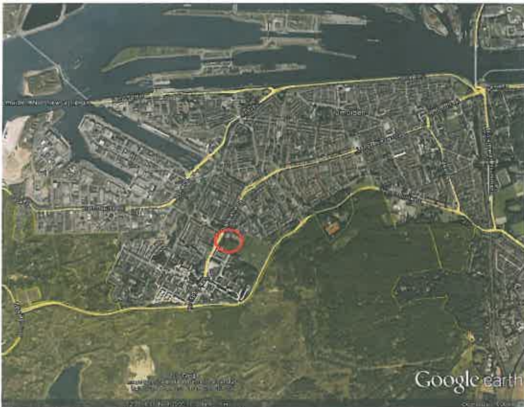
Figuur 1. Ligging van het plangebied te IJmuiden

Op 13 november 2012 is een veldbezoek gebracht aan het terrein. Dit veldonderzoek is bedoeld om inzicht te krijgen in het voorkomen of mogelijk voorkomen van binnen de Flora- en faunawet beschermde planten- en diersoorten. Het veldbezoek heeft overdag plaatsgevonden, waarbij een goed beeld is verkregen van het terrein en welke beschermde soorten daarin voor (kunnen) komen.