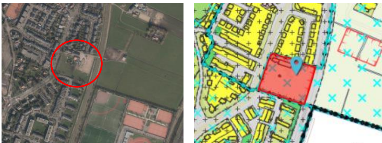
Figuur 1: Ligging plangebied en duiding wijzigingsgebied

Om deze ontwikkeling mogelijk te maken wordt namens de initiatiefnemer een wijzigingsplan opgesteld. In het kader van dit wijzigingsplan dient te worden onderbouwd dat de ontwikkeling voldoet aan de wijzigingsvoorwaarden uit het moederplan, alsmede de relevante wet- en regelgeving. Indien een bestemmings- c.q. wijzigingsplan een nieuwe stedelijke ontwikkeling mogelijk maakt, dient deze te worden getoetst aan de kaders van de ‘Ladder voor duurzame verstedelijking’ (zie hoofdstuk 2). Omdat deze afweging niet heeft plaatsgevonden bij vaststelling van het moederplan wordt in het kader van het wijzigingsplan deze toetsing doorlopen. De voorliggende notitie wordt als bijlage bij het wijzigingsplan opgenomen.